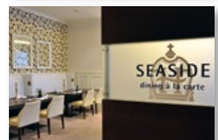
Muetsrefotos - klassisch

Bei Fragen und für weitere Informationen stehen wir Ihnen gerne zur Verfügung